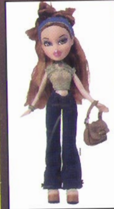
حتى لعب الأطفال أصبحت شاكيرا

إنها المغنية الكولومبية وتضجر بأصولها اللبنانية وتغني بالاسبانية والانكليزية. قالت في إحدى المقابلات رداً على سؤال إنها لا تمانع يوماً من الغناء باللهجة اللبنانية التي تحبها كثيراً وتسمع أهلها يتحدثون بها من وقت لآخر. إن شاكيرا استطاعت بإدائها الراقص المميز أن تحجب مغنيات شهيرات مثل كريستينا لاغويرا وبريثني سبيرس. شاكيرا، إيزابيل مبارك ريبول، اسمها الحقيقي ولدت في ٢ شباط/فبراير من العام ١٩٧٧ في مدينة برانكيلا في كولومبيا على شاطئ بحر الكاريبي ابنة وحيدة من عائلة لبنانية الأصل.